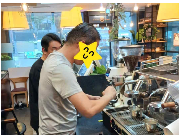
C님 실천활동(바리스타 체험)