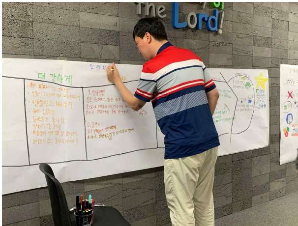
B님 북극성 찾기(PATH회의)