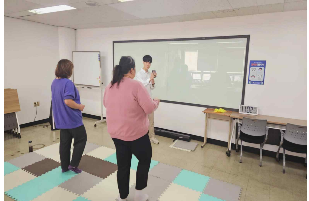
A님 실천활동(건강하게 감량하기)