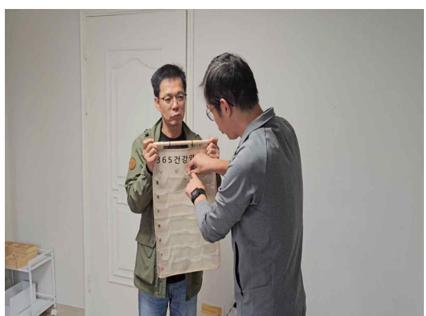
C님 실천활동(스스로 약 복용하기)